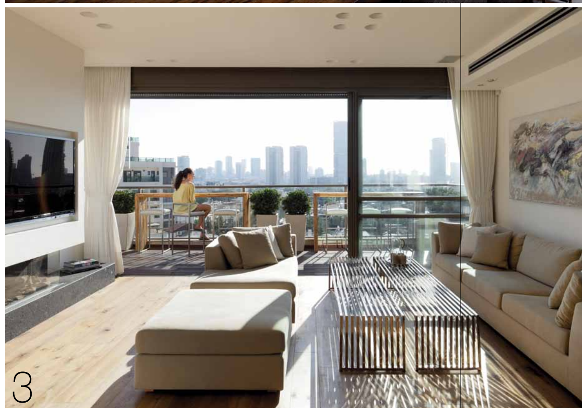
2,3. במטבח, מול חלון הפונה לנוף, נקבעה מראה גדולה המשפיעה על תחושת הגודל ואוויריות במטבח, פינת האוכל והסלון (מטבח: "דגבה", קמין: "פרביטל", עבודות גמר: "אפקט דיזיין", תאורה: "לייט אין", ציור: מרלן פרד).